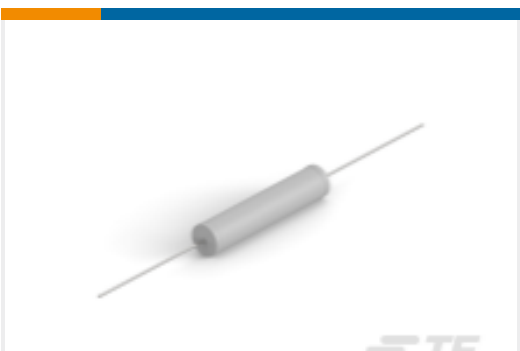
TE 产品编号9-2176415-0 8W STD M/OX 5% 150K