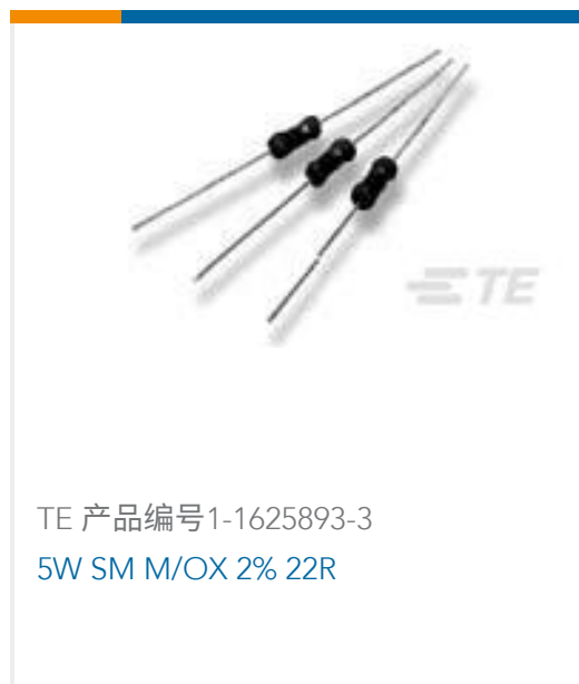
TE 产品编号 1-1625893-3 5W SM M/OX 2% 22R