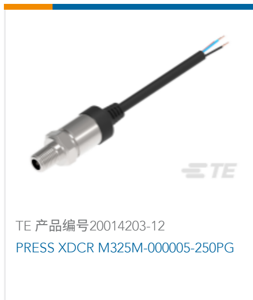
TE 产品编号 20014203-12 PRESS XDCR M325M-000005-250PG