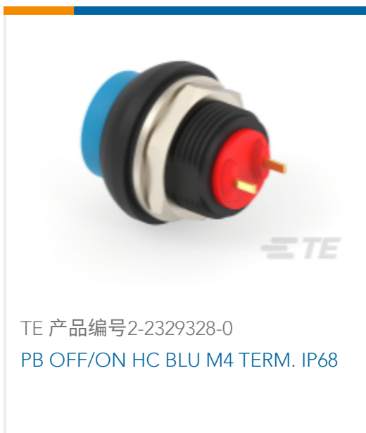
TE 产品编号 2-2329328-0 PB OFF/ON HC BLU M4 TERM. IP68