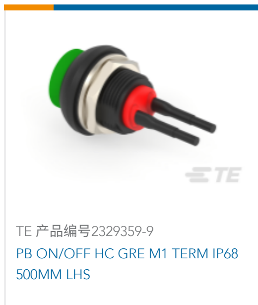
TE 产品编号 2329359-9 PB ON/OFF HC GRE M1 TERM IP68 500MM LHS