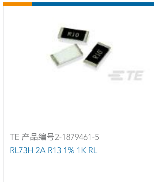
TE 产品编号 2-1879461-5 RL73H 2A R13 1% 1K RL