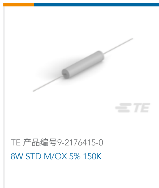
TE 产品编号 9-2176415-0 8W STD M/OX 5% 150K