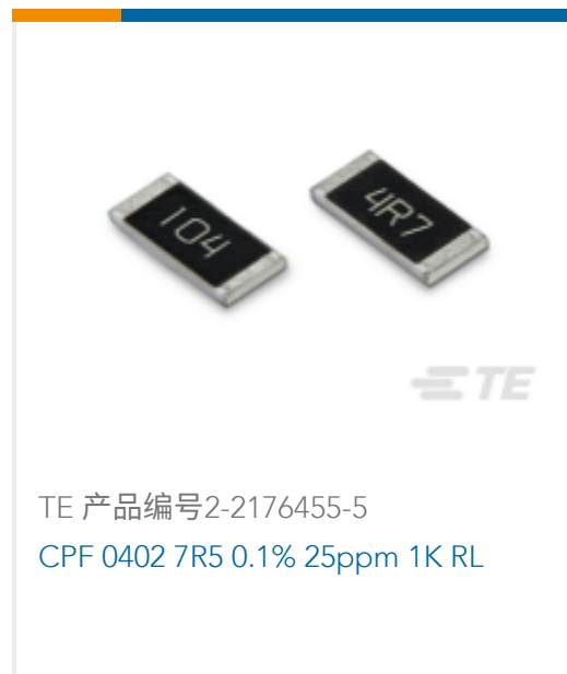
TE 产品编号 2-2176455-5 CPF 0402 7R5 0.1% 25ppm 1K RL