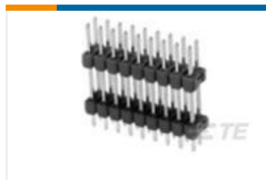
TE 产品编号5-146496-2 04 MODII HDR DRST UNSHRD STKG