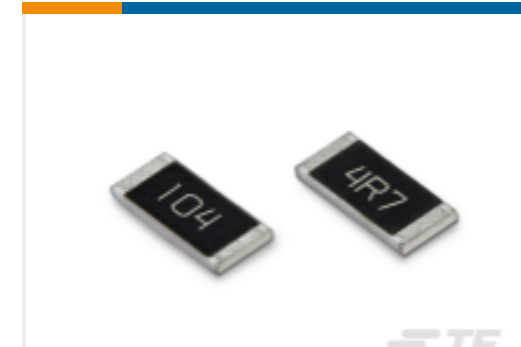
TE 产品编号2-2176455-5 CPF 0402 7R5 0.1% 25ppm 1K RL