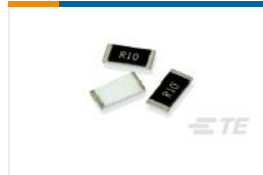
TE 产品编号2-1879461-5 RL73H 2A R13 1% 1K RL