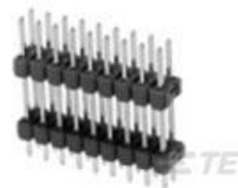
TE 产品编号5-146496-2 04 MODII HDR DRST UNSHRD STKG