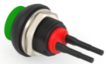
TE 产品编号2329359-9 PB ON/OFF HC GRE M1 TERM IP68 500MM LHS