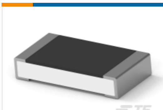
TE 产品编号1-2176391-0 RQ 1206 15K4 0.1% 10PPM 5K RL