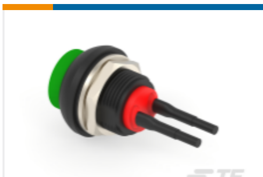
TE 产品编号2329359-9 PB ON/OFF HC GRE M1 TERM IP68 500MM LHS