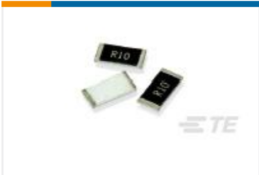
TE 产品编号2-1879461-5 RL73H 2A R13 1% 1K RL