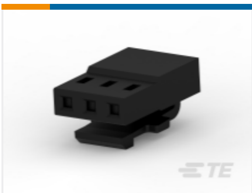
TE 产品编号2316104-3 3P,2MM,REC,HSG,SR,CRIMP,LATCH, BOX