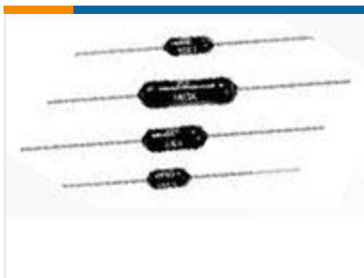
TE 产品编号7-1879621-1 H4P 8K2 1% 50PPM