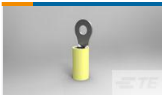
TE 产品编号2-320568-2 TERM, RT, PIDG IR, 12, #8