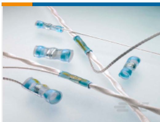
TE 产品编号CJ8362-000 S200-4-W2-22-9