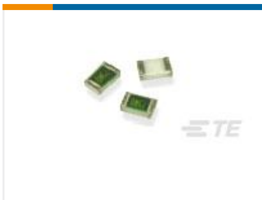
TE 产品编号1676271-2 RN 0805 26K1 0.1% 10PPM 1KRL