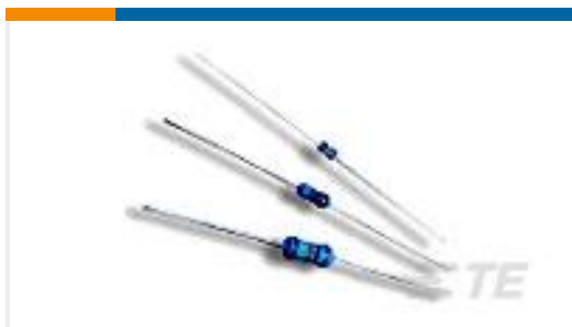
TE 产品编号2-1676913-6 YR1 0.1% 1K0