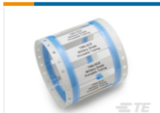
TE 产品编号6641710001 TMS-SCE Military Grade Sleeves