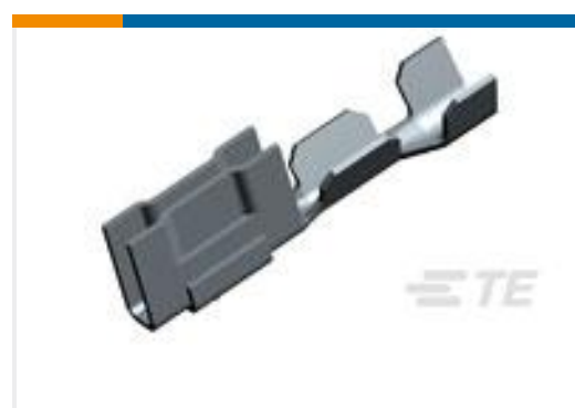
TE 产品编号1445336-1 LOOSE PC CONTACT TIN PLATED