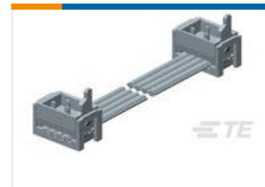
TE 产品编号2205063-3 CA MICRO-MATCH MOW-MOW 10POS