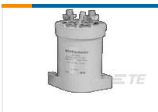
TE 产品编号9-1618389-8 LEV100A5ANG=RELAY, SPST, 24Vdc