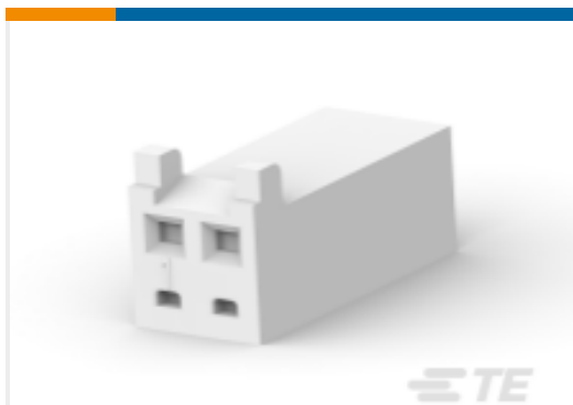
TE 产品编号1375820-4 Receptacle Housing: 2.54mm, 1 Row, CST-100 II