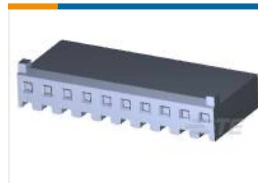
TE 产品编号1-770849-0 10P SL156 HSG W/LCK RMP & TABS