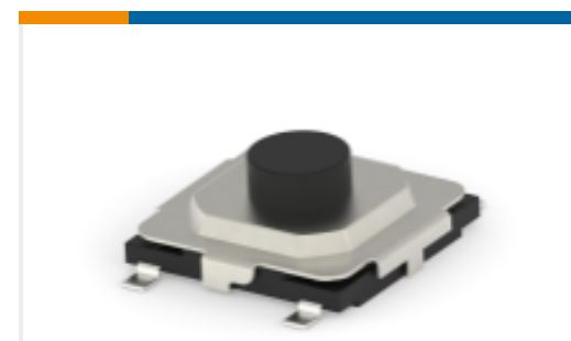
TE 产品编号2337238-3 TACT MINI GW 5.2X5.2X2 160GF