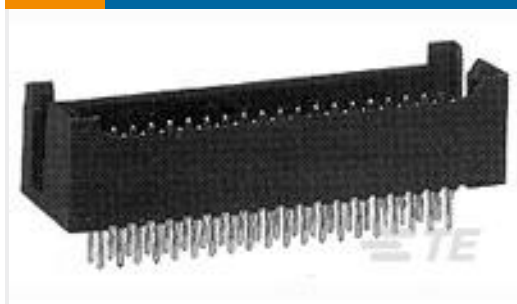
TE 产品编号5-102567-2 24 MODII 2PC HDR DR SHRD .100,ROHS