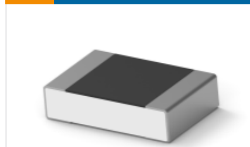
TE 产品编号6-2176379-5 RQ 0805 499R 0.1% 10PPM 5K RL