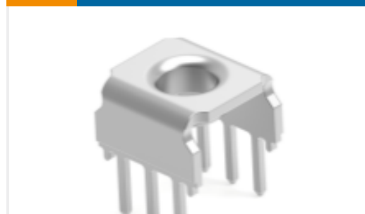
TE 产品编号214788-E EPSVA KS GDM4 TL 6 3,8 SN * STROMVERSORG