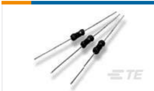
TE 产品编号8-1879354-9 RR03 5% 1K5 AMMO