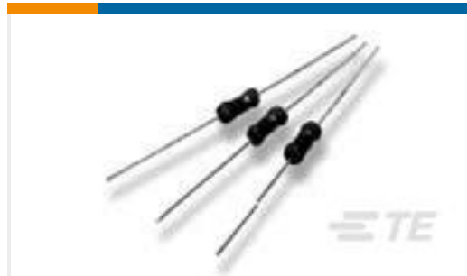
TE 产品编号9-1879354-2 RR03 5% 2K0 AMMO