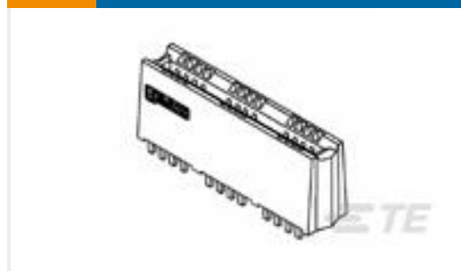
TE 产品编号6651214-1 286-0022-12100=CONN,SKT,CRNEDGE