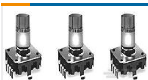
TE 产品编号 2-1879749-3 LED ENCODER 12MM HORIZ SW GR/RD