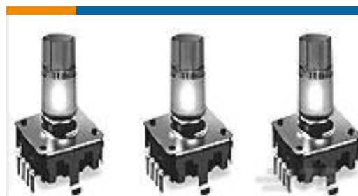
TE 产品编号 4-1879314-7 DPL12S 24P 24DET 21F RD/GRN