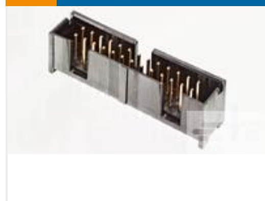
TE 产品编号2-1761603-9 IDC LOW PRO HDR 26P VERT BLUE