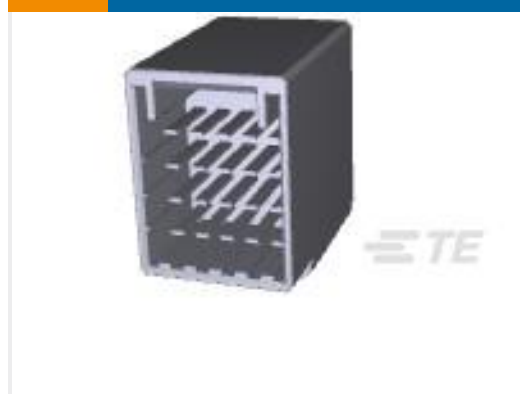
TE 产品编号917251-2 DYNAMIC D-3400F HDR ASSY 20P H