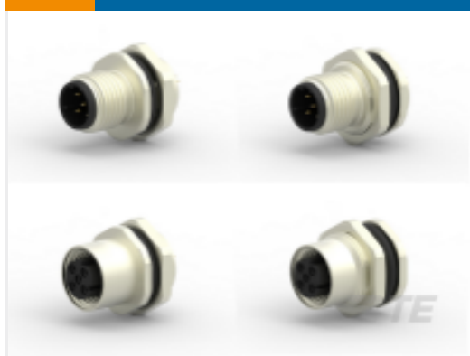
TE 产品编号T4133012051-000 M12 面板安装焊杯