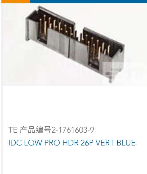
TE 产品编号2-1761603-9 IDC LOW PRO HDR 26P VERT BLUE