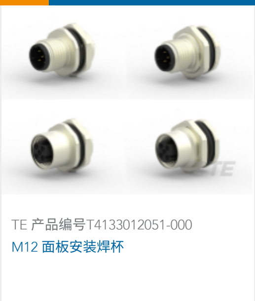
TE 产品编号T4133012051-000 M12 面板安装焊杯