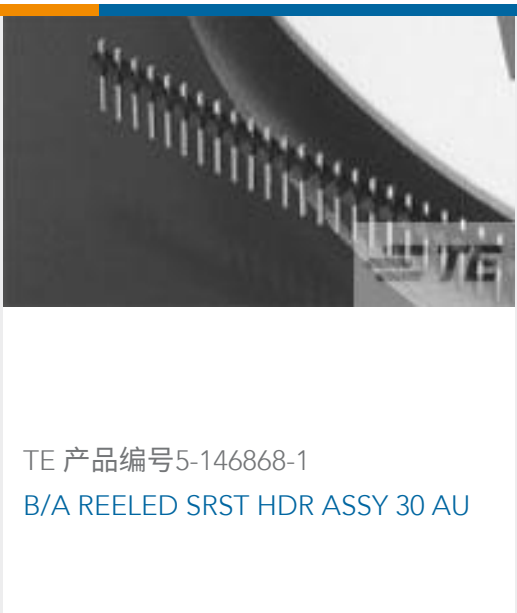
TE 产品编号5-146868-1 B/A REELED SRST HDR ASSY 30 AU