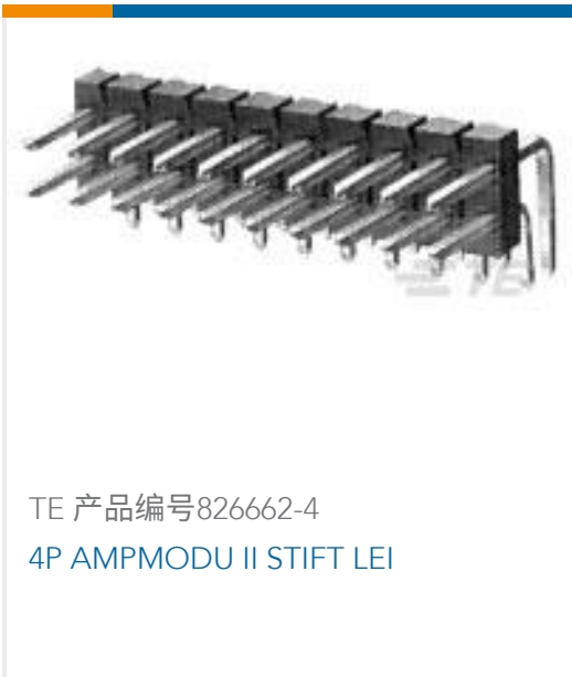
TE 产品编号826662-4 4P AMPMODU II STIFT LEI