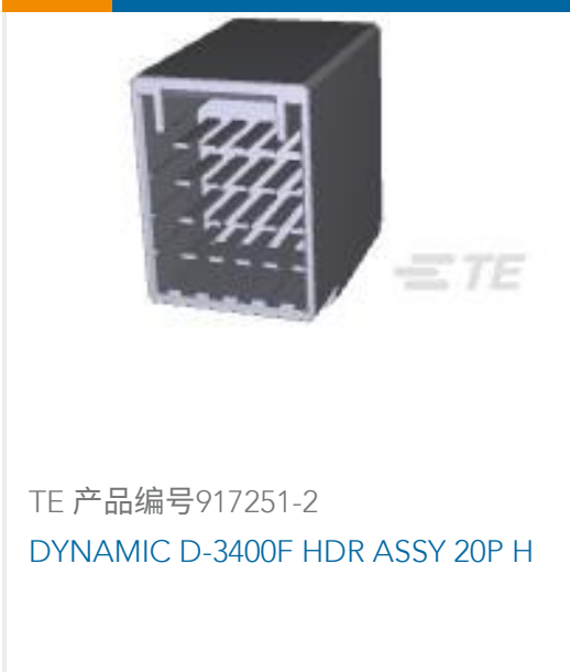
TE 产品编号917251-2 DYNAMIC D-3400F HDR ASSY 20P H