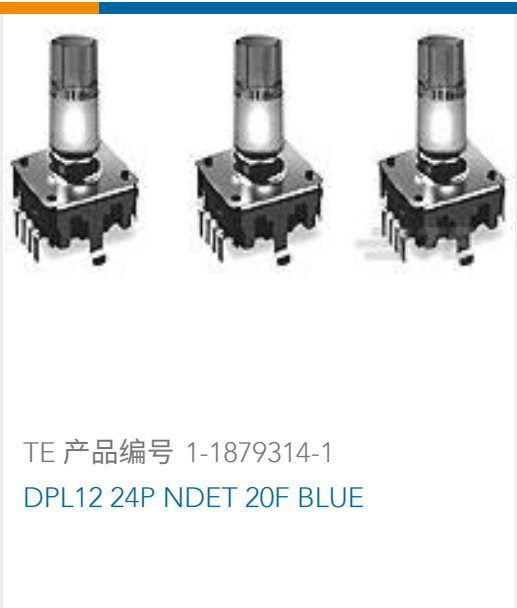
TE 产品编号 1-1879314-1 DPL12 24P NDET 20F BLUE