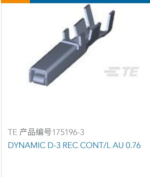
TE 产品编号175196-3 DYNAMIC D-3 REC CONT/L AU 0.76