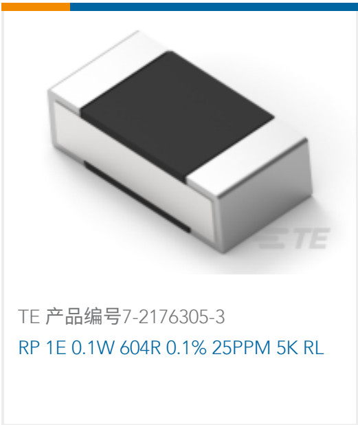
TE 产品编号7-2176305-3 RP 1E 0.1W 604R 0.1% 25PPM 5K RL