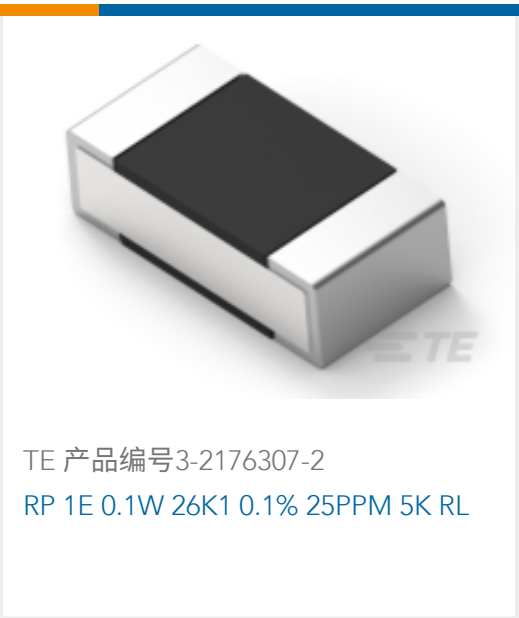
TE 产品编号3-2176307-2 RP 1E 0.1W 26K1 0.1% 25PPM 5K RL