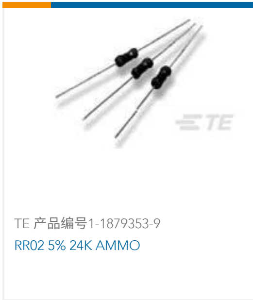
TE 产品编号1-1879353-9 RR02 5% 24K AMMO