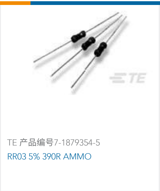
TE 产品编号7-1879354-5 RR03 5% 390R AMMO