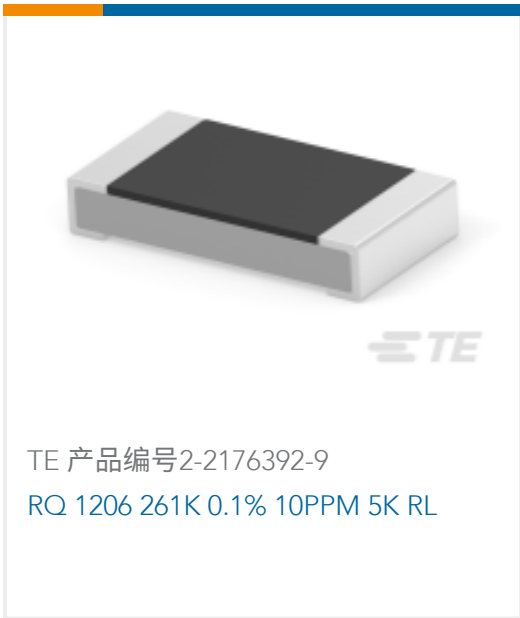
TE 产品编号2-2176392-9 RQ 1206 261K 0.1% 10PPM 5K RL