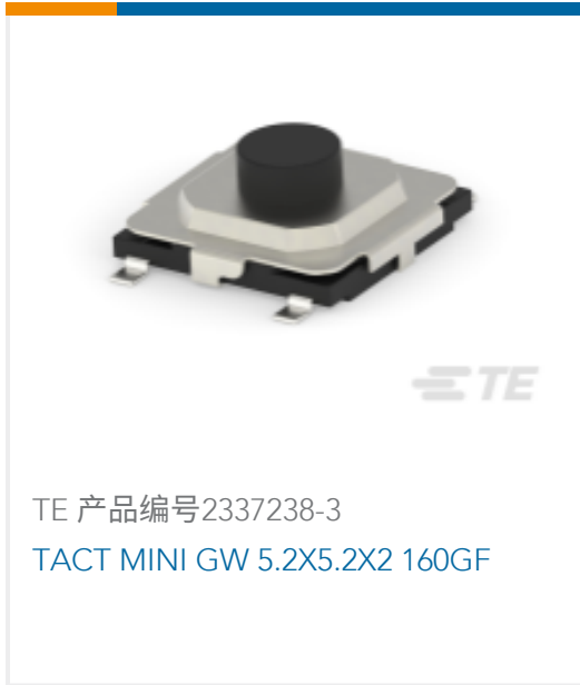
TE 产品编号2337238-3 TACT MINI GW 5.2X5.2X2 160GF