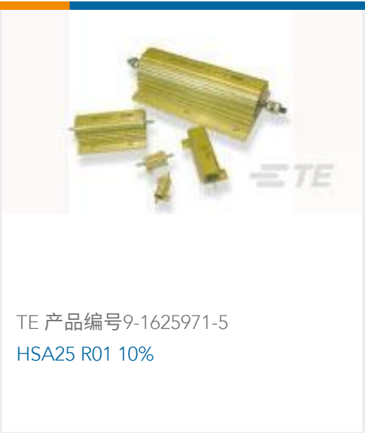
TE 产品编号9-1625971-5 HSA25 R01 10%