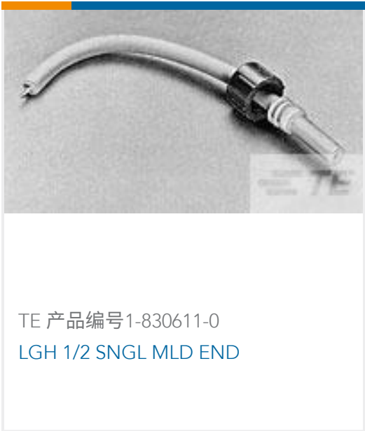
TE 产品编号1-830611-0 LGH 1/2 SNGL MLD END