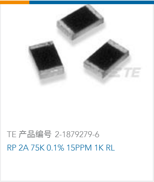
TE 产品编号 2-1879279-6 RP 2A 75K 0.1% 15PPM 1K RL