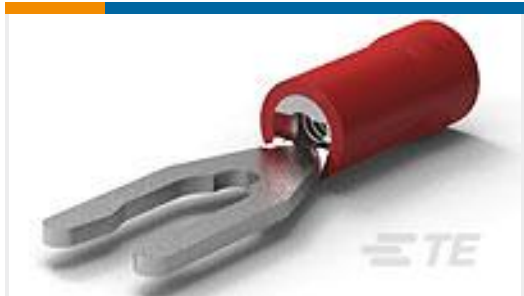
TE 产品编号52453-1 PG SPR SPD 22-16COMM22-18MIL 6