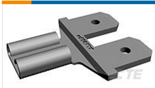
TE 产品编号63699-1 ADAPTER 187 FASTON TPBR