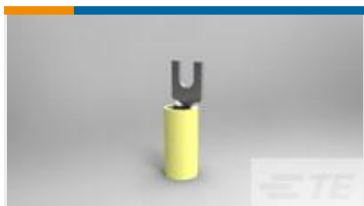
TE 产品编号53115-2 TERMINAL,PIDG SPD 26-24 6