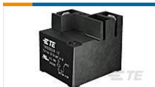
TE 产品编号1-1393210-3 T9AS1D12-12