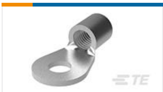
TE 产品编号52197 TERMINAL,SOLIS R 6 10