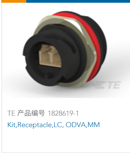
TE 产品编号 1828619-1 Kit, Receptacle, LC, ODVA, MM