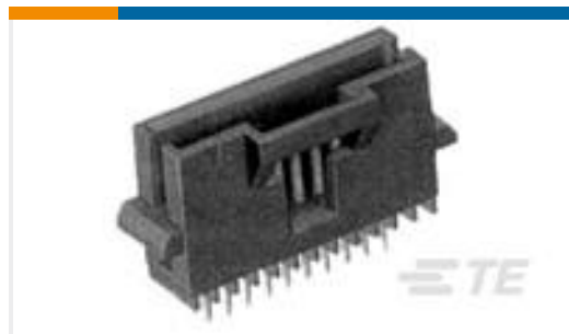
TE 产品编号 5-146085-1 10 SYSTEM 50 HDR SRST SHRD SN