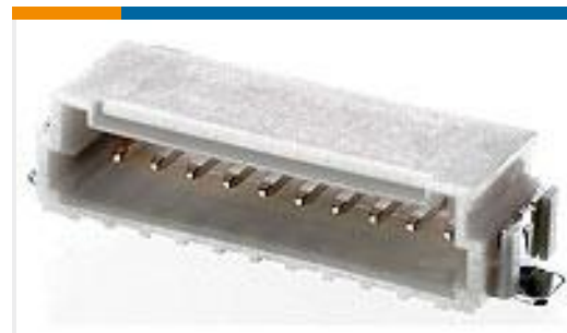
TE 产品编号 5-292227-3 1.5 MINI CT SGL H SMT W BOSS 3