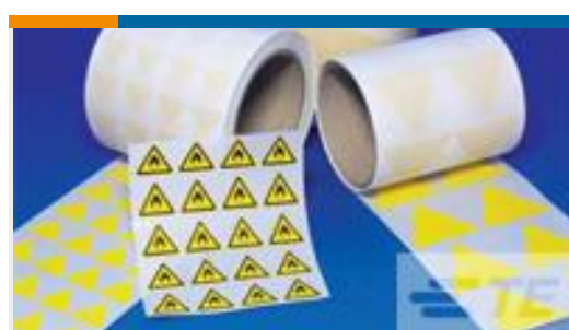
TE 产品编号9-1768017-7 EET-0825P-4