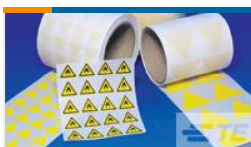
TE 产品编号4-1768018-2 EET-1325P-4