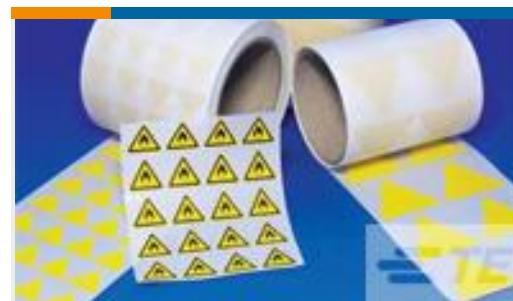
TE 产品编号9-1768017-2 EET-0820P-4