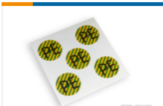
TE 产品编号7-1768034-3 LKZ Vinyl Electric Symbol Labels