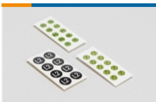
安全符号和电气符号(44)