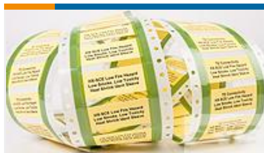
TE 产品编号C28032-000 HX-SCE-2.5K-6.4-50-4