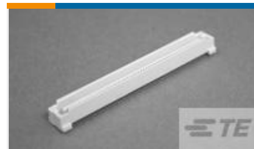
TE 产品编号5177986-1 0.8FH,P05H.5,040,08/Sn,TR,SC