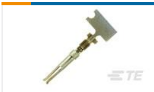
TE 产品编号66504-9 SOCKET CONTACT, 20 DF