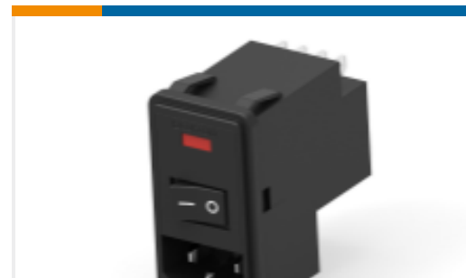
TE 产品编号4-6609951-3 PS0SXDSX0=C4457