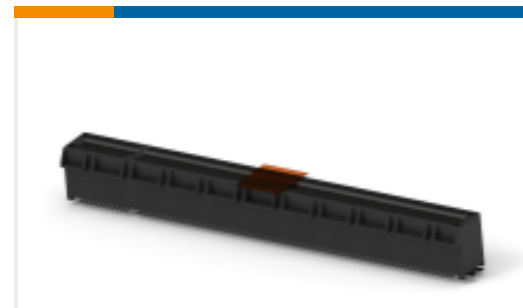
TE 产品编号 5-2337939-4 PCIE GEN4 CON,SMT,164POS,30u", MYLAR,HT