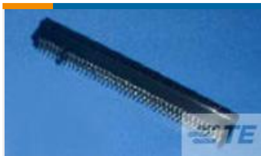
TE 产品编号 1734774-1 PCI EXP 3.1L 36 POS WHT G/F