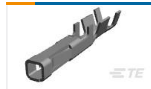
TE 产品编号1-794610-2 MICRO MNL RPT CNT,LS PC 30AU L