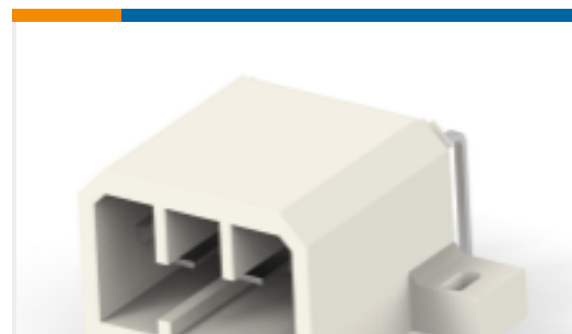
TE 产品编号172040-1 MIC CAP 5P H