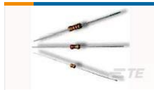
TE 产品编号 2-1623929-2 CFR200 5% 22K