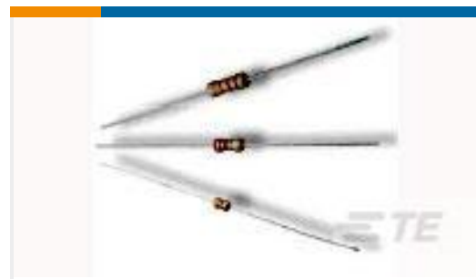
TE 产品编号 1623930-3 CFR25 5% 10K