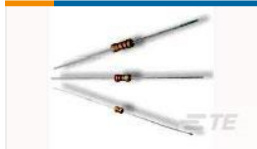
TE 产品编号 1623932-8 CFR50 5% 10K