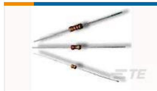
TE 产品编号 1623927-8 CFR16 5% 120R