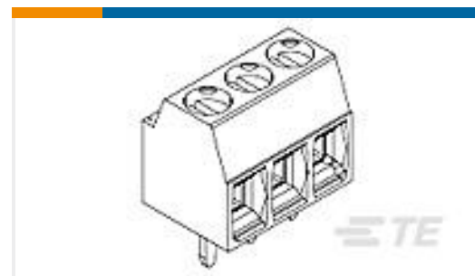
TE 产品编号1776112-4 4P, 2.60MM, SIDE ENTRY, HIGH TMP