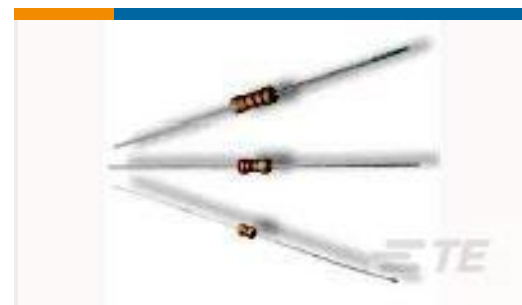
TE 产品编号1623930-3 CFR25 5% 10K