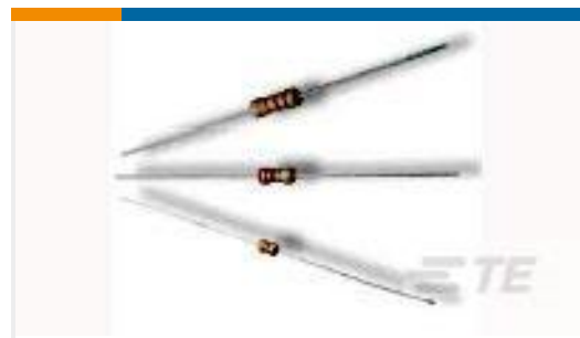
TE 产品编号 1623925-2 CFR100 5% 100R