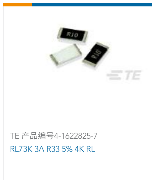
TE 产品编号4-1622825-7 RL73K 3A R33 5% 4K RL