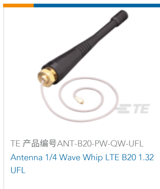
TE 产品编号ANT-B20-PW-QW-UFL Antenna 1/4 Wave Whip LTE B20 1.32 UFL