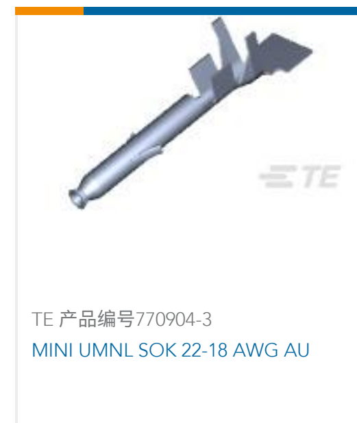
TE 产品编号770904-3 MINI UMNL SOK 22-18 AWG AU