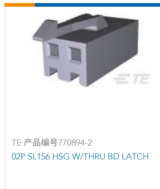
TE 产品编号770894-2 02P SL156 HSG W/THRU BD LATCH