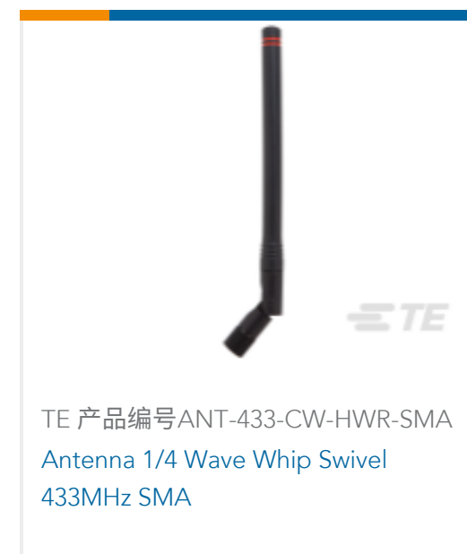
TE 产品编号ANT-433-CW-HWR-SMA Antenna 1/4 Wave Whip Swivel 433MHz SMA