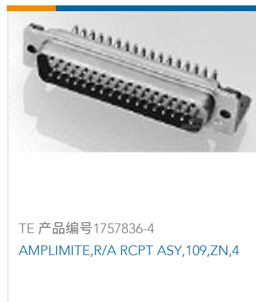
TE 产品编号1757836-4 AMPLIMITE, R/A RCPT ASY, 109, ZN, 4