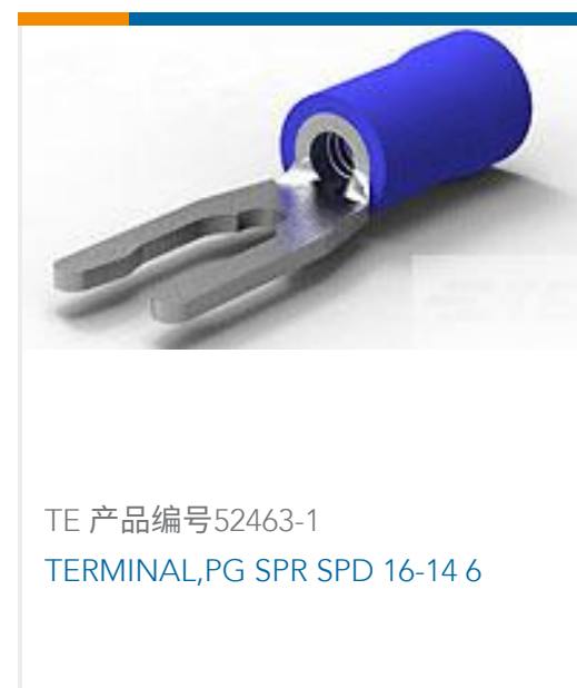
TE 产品编号52463-1 TERMINAL, PG SPR SPD 16-14 6