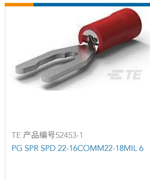
TE 产品编号52453-1 PG SPR SPD 22-16COMM22-18MIL 6