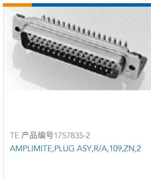
TE 产品编号1757835-2 AMPLIMITE, PLUG ASY, R/A, 109, ZN, 2