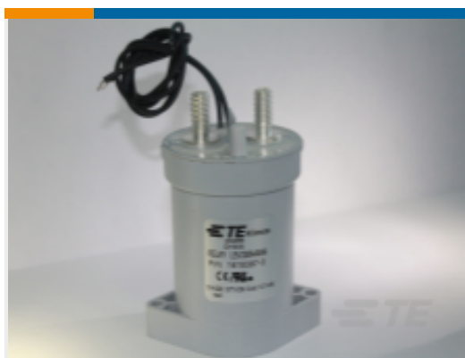
TE 产品编号 7-1618387-2 LEV200A5ANF=RELAY, SPST-NO