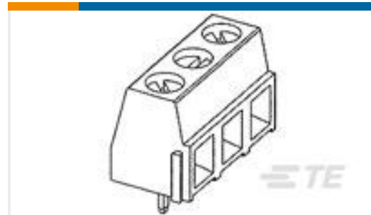
TE 产品编号282836-3 TERMI-BLOK PCB MOUNT 90 3P.