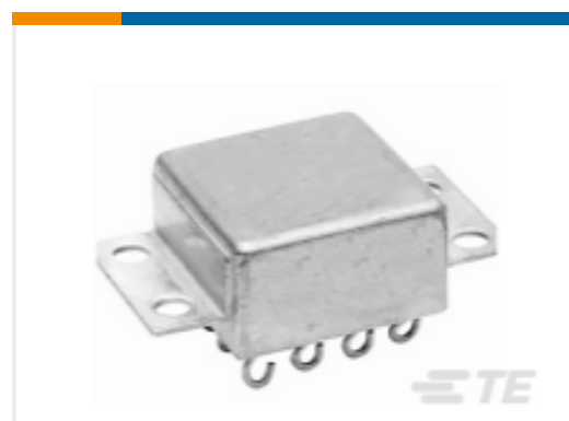
TE 产品编号8-1617349-0 3SBM1089A2=M39016/36-006M