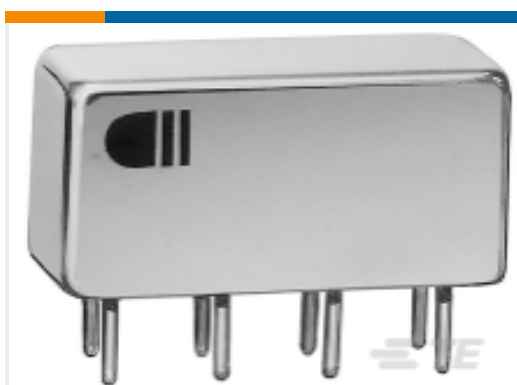
TE 产品编号3-1617515-0 3SBC1793A2=M39016/13-101M