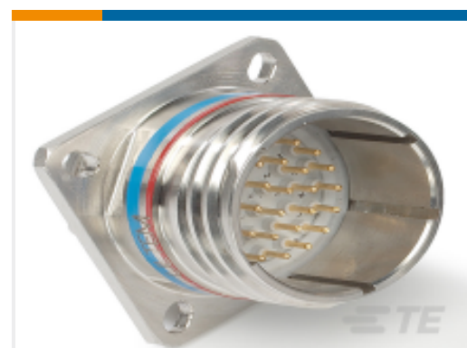
TE 产品编号YDTS20F19-35JAV001 RECP ASSY