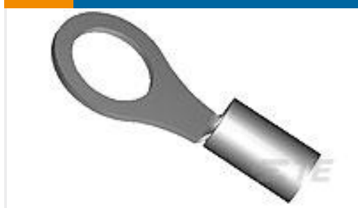
TE 产品编号34567 TERMINAL,SOLIS R 16-14HD 10