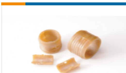
TE 产品编号EM6343-000 R85049/93-08