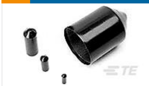
TE 产品编号843031-000 101A011-3-0