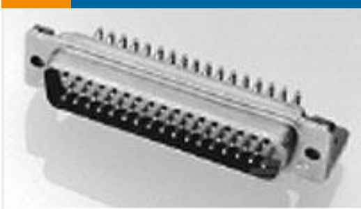
TE 产品编号1218408-3 AMPLIMITE,ASY,RCPT,RTANG,109,3