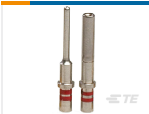
TE 产品编号ZPF000000000000435 006-1189-20