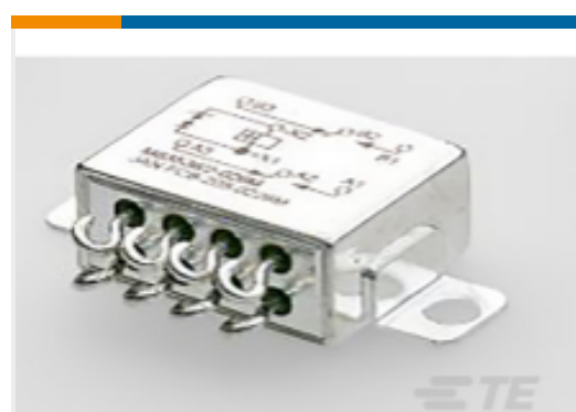
TE 产品编号 4-1617758-7 FCB-205-0222M=M83536/2-022M