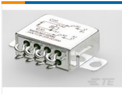
TE 产品编号4-1617758-2 FCB-205-0215M=M83536/2-015M