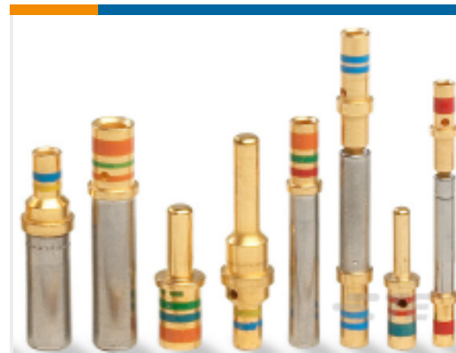
TE 产品编号ZPF0000000000003651 724-8022-16