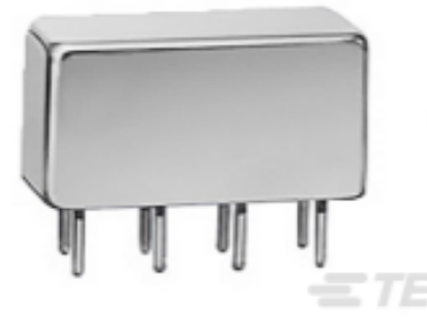
TE 产品编号3-1617536-2 HFW1230F01P=M39016/6-119P