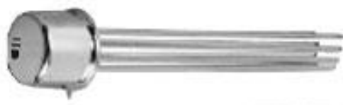
TE 产品编号3-1617118-0 J1MACDD-12XP = M39016/24-028P