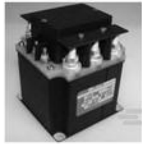
TE 产品编号1616021-6 SA136A=CONTACTOR 3PST N.O. 75