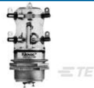
TE 产品编号1-1618273-5 H-16C=RELAY, VACUUM, DPDT