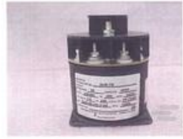
TE 产品编号1-1616037-6 DHR7B=CONTACTOR - 3PDT