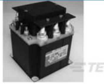
TE 产品编号1616021-6 SA136A=CONTACTOR 3PST N.O. 75