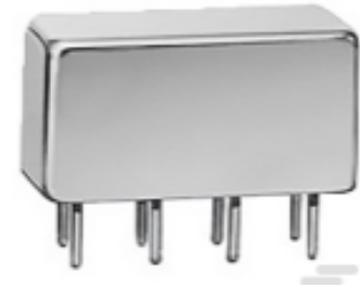
TE 产品编号3-1617536-2 HFW1230F01P=M39016/6-119P