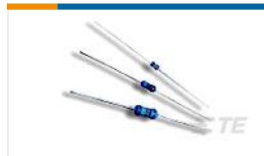
TE 产品编号 1622730-1 LR2 1% 30K