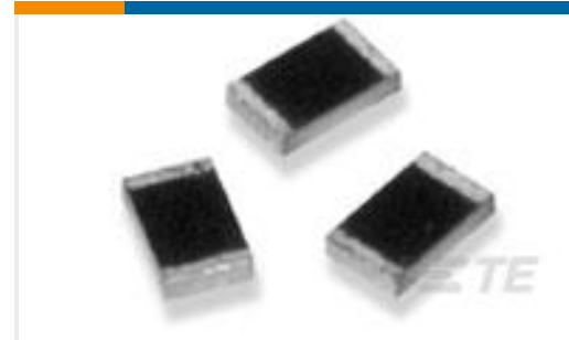
TE 产品编号 1-1879259-6 RP 2B 1K37 0.1% 15PPM CUT LENGTH