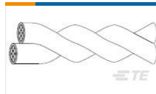
TE 产品编号 3832233001 44A0121-26-0/2