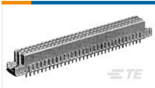
TE 产品编号535090-4 096 EURO TYPE C RECEPT ST ASSY