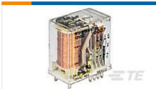
TE 产品编号1-1393767-5 R10-E2X2-V700=R10