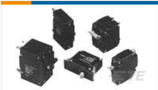
TE 产品编号6-1393252-1 W67-X2Q12-30=M6/M7/M9/W6/W7