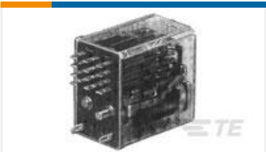
TE 产品编号1-1393766-9 R10-E1X4-24V=R10