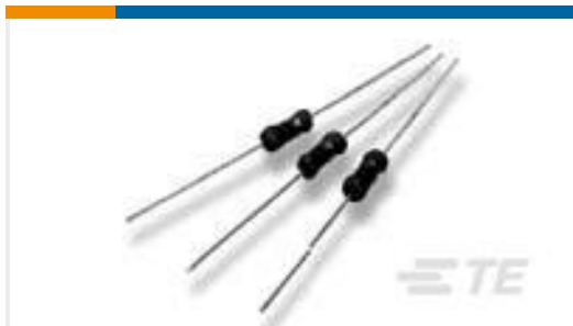
TE 产品编号7-1625890-0 2W SM M/OX 5% 82K