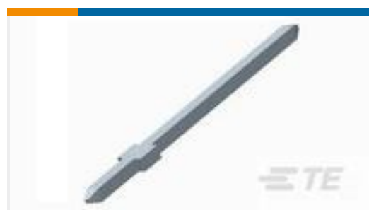
TE 产品编号1-928836-2 MOD2 PIN WITH A-PIN L/P