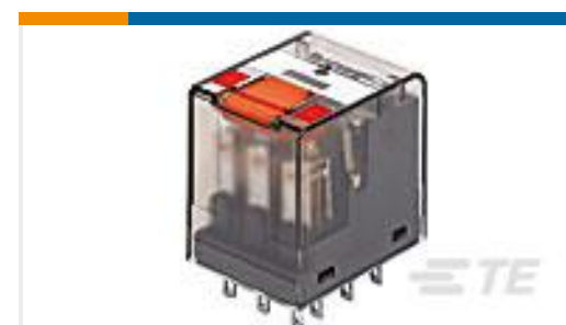
TE 产品编号3-1415020-1 PT570N20