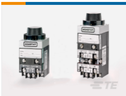
TE 产品编号 1-1423159-9 7012PB=RLY,STD,ON,2P,125VDC, 5