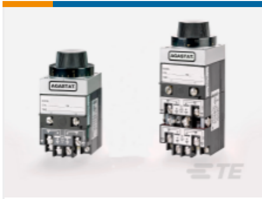
TE 产品编号 2-1423159-3 7012PC=RLY,STD,ON,2P,125VDC,15