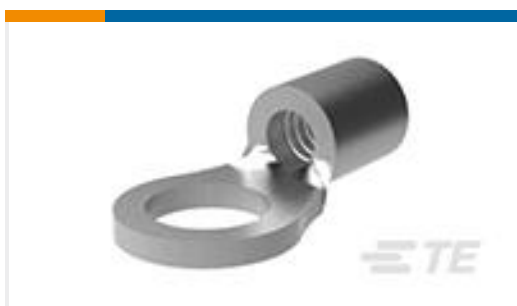
TE 产品编号2-33457-2 TERMINAL,SOLIS R 12-10 10