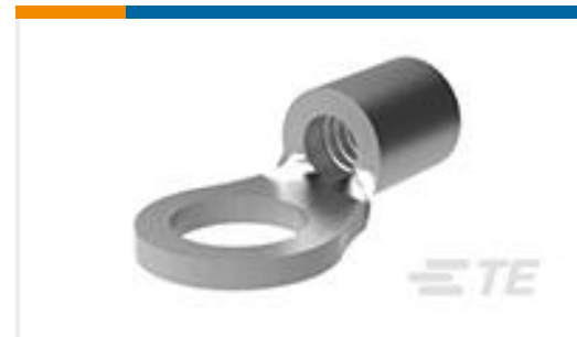
TE 产品编号322454 TERMINAL,SOLIS R 12-10 8