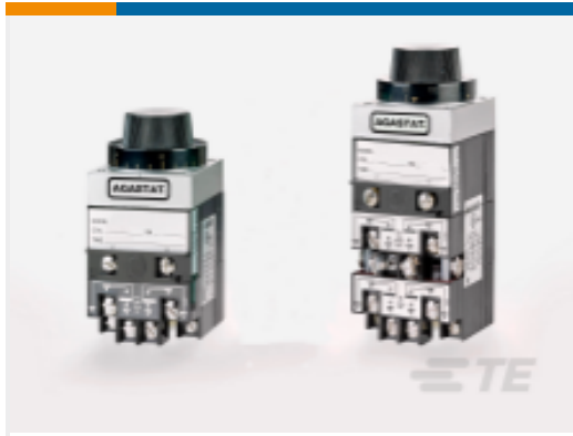
TE 产品编号 2-1423162-9 7022BK=RLY,STD,OFF,M2P,240VAC,