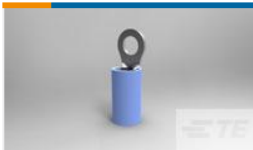
TE 产品编号51864 TERMINAL,PIDG R 16-14 6