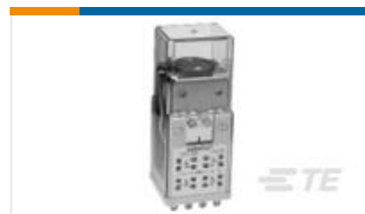
TE 产品编号1423155-6 GPDN=RLY,GEN,PURP,125VDC