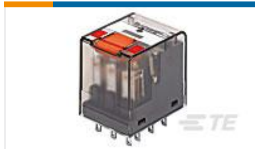
TE 产品编号3-1415020-1 PT570N20