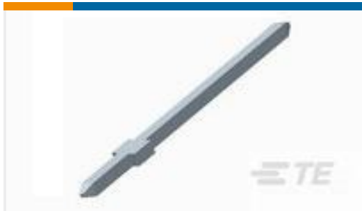
TE 产品编号1-928836-2 MOD2 PIN WITH A-PIN L/P