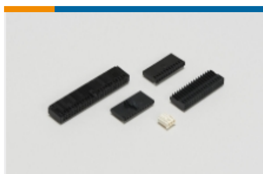
线到板连接器组件和护套(5)