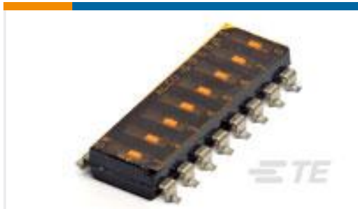
TE 产品编号1-1825006-9 GDS10S04=DIP SW,SLIDE,SMT