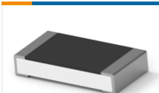
TE 产品编号4-2176391-7 RQ 1206 37K4 0.1% 10PPM 5K RL