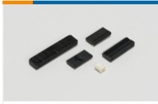
线到板连接器组件和护套(5)