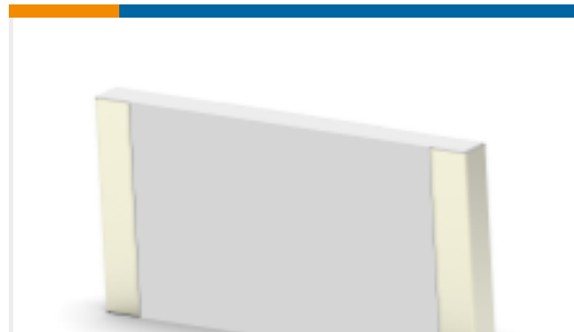
TE 产品编号7-2176246-6 CRGS2512 5% 1M8