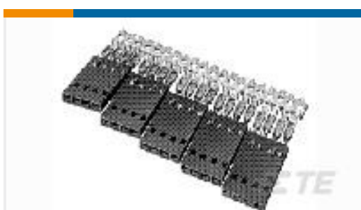
TE 产品编号103688-5 06 MTE RCPT HSG SR PLAIN .100