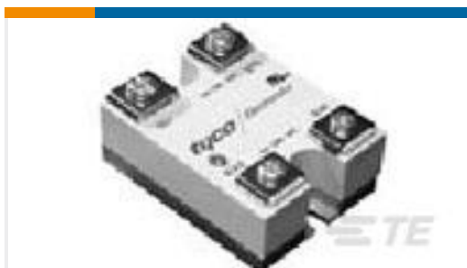
TE 产品编号1-1393030-0 SSR-240D50= PANEL MOUNT, 50A, 240VAC-DC i/p