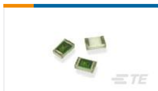
TE 产品编号2176087-2 RP 1J 0.166W 69R8 0.1% 25PPM 1K RL