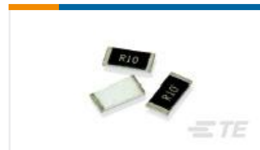
TE 产品编号2176057-7 RLP73V 3A R018 1% 1K RL