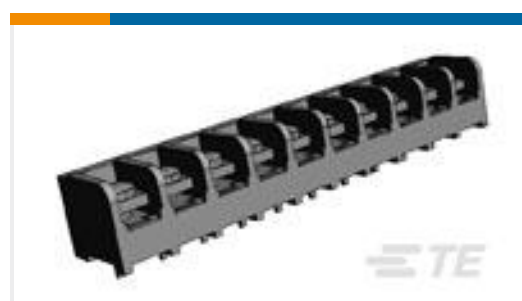
TE 产品编号3-1437653-5 6PCV-10-006=6PCV ASSEMBLY