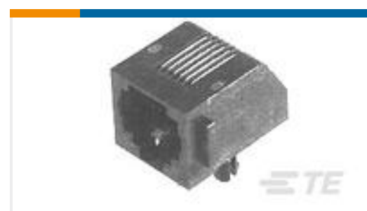
TE 产品编号5555164-1 MJ,LPF,R/A,8P,TRAY