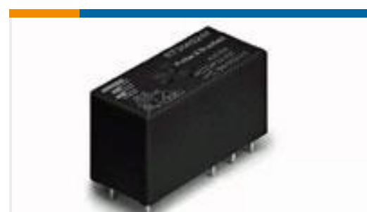
TE 产品编号2-1419108-5 RTB14012F