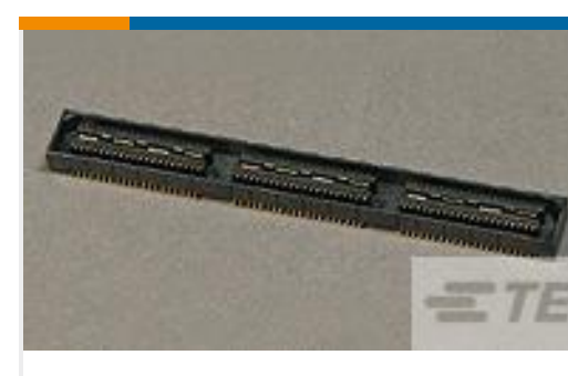
TE 产品编号2-1658012-3 MSB0.80RC-ASY120FL,-,10,-TY