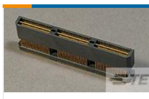
TE 产品编号1658017-3 MSB0.80PL19ASY120FL,-,10,-TY