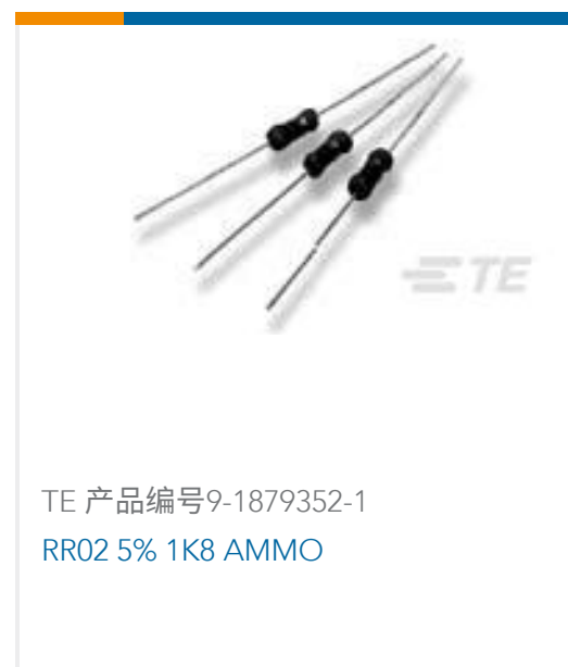
TE 产品编号9-1879352-1 RR02 5% 1K8 AMMO