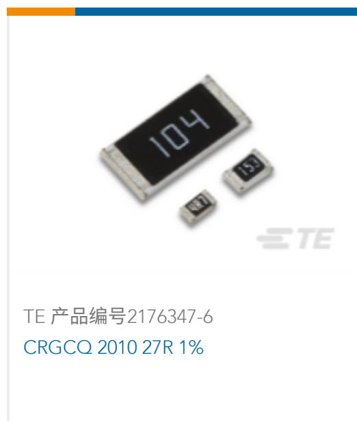
TE 产品编号2176347-6 CRGCO 2010 27R 1%