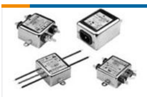
TE 产品编号1-6609027-5 10EK7=F7095 S0