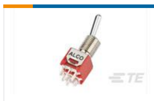
TE 产品编号2267077-1 TMS1T4B5M2RE