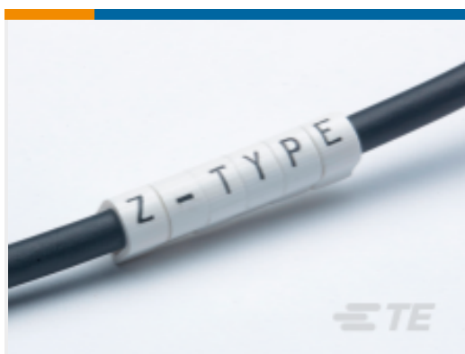
TE 产品编号 EC0437-000 06153411