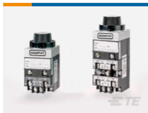
TE 产品编号 1755170-1 7022OCIM=RLY,STD,OFF,2P,24V,15S,I, M