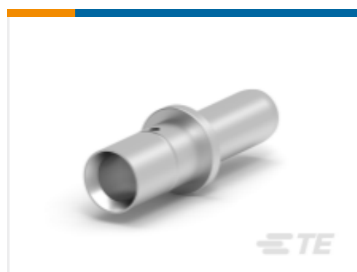
TE 产品编号SRK-PC-080-25-601 PIN, SOLID, SIZE M8, 25mm2, AG