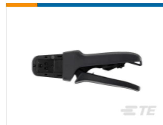
TE 产品编号DTT-20-03 CRIMP TOOL