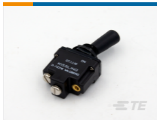
TE 产品编号K1007153 Toggle Switch 08-1-1-13