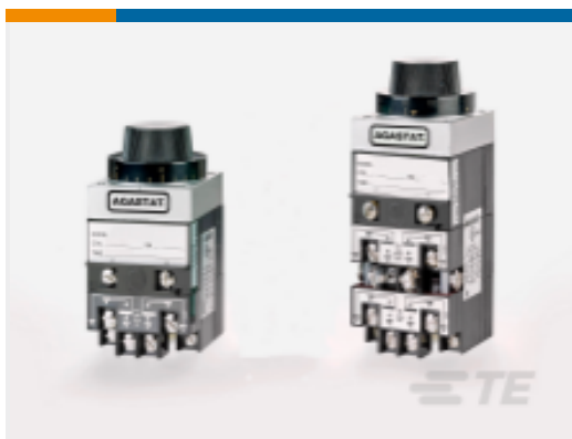
TE 产品编号 3-1423159-3 7012PJ=RLY,STD,ON,2P,125VDC,1