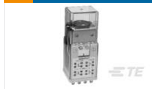
TE 产品编号1423156-4 GPIN=RLY,120VAC,BOD