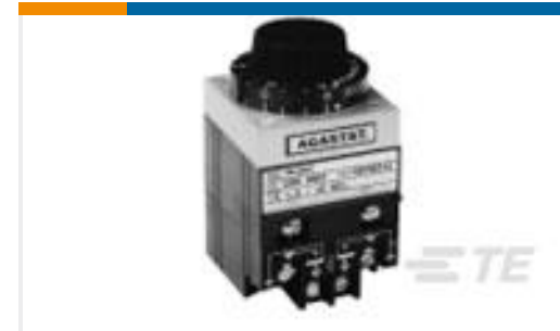
TE 产品编号1423164-5 7022ND=RLY,STD,OFF,2P,48VDC,5