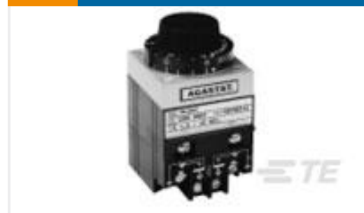
TE 产品编号1423164-4 7022NC=RLY,STD,OFF,2P,48VDC,1