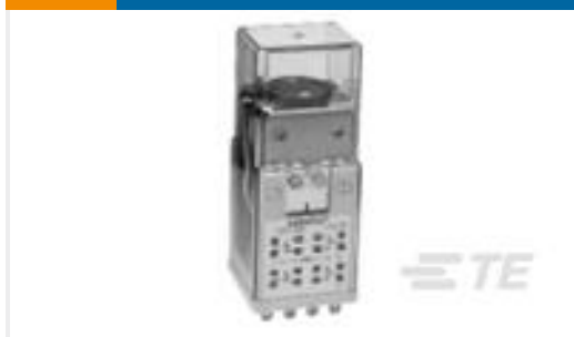
TE 产品编号1423155-6 GPDN=RLY,GEN,PURP,125VDC