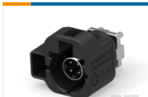
TE 产品编号2315239-1 6POS,HSD DIA 0.6,HDR ASSY,180DEG, COD A