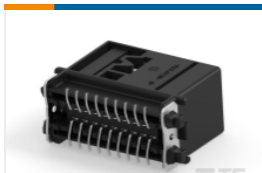
TE 产品编号1438543-2 18P SMT LAC HDR ASY KEY BE,WHT