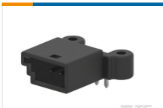
TE 产品编号936166-2 Signal Header