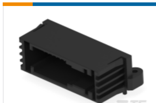
TE 产品编号1-968720-4 32pos MQS .63 header 90deg