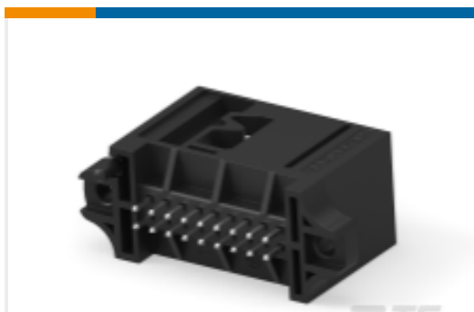
TE 产品编号2296121-1 18P HEADER ASSY