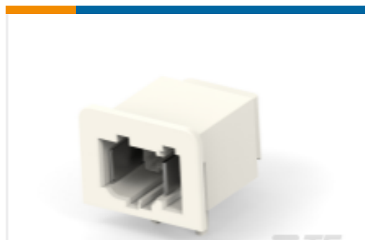
TE 产品编号2304372-2 1-PORT MATENET HDR ASSY 90DEG, COD B