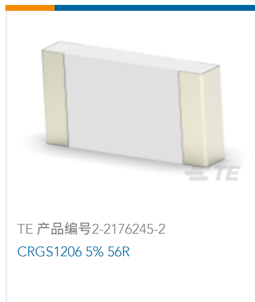
TE 产品编号2-2176245-2 CRGS1206 5% 56R