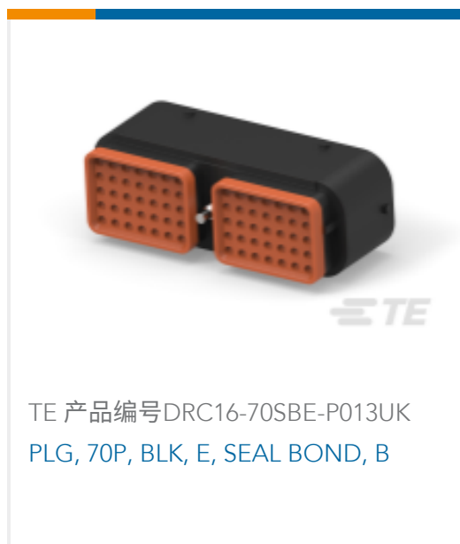
TE 产品编号DRC16-70SBE-P013UK PLG, 70P, BLK, E, SEAL BOND, B