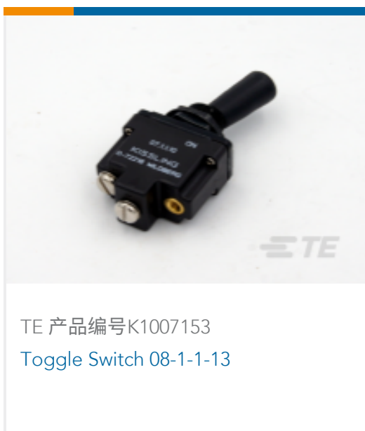
TE 产品编号K1007153 Toggle Switch 08-1-1-13