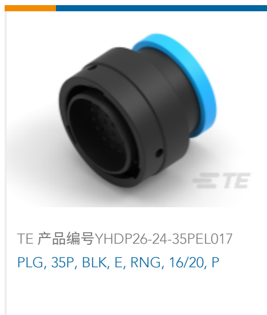
TE 产品编号YHDP26-24-35PEL017 PLG, 35P, BLK, E, RNG, 16/20, P