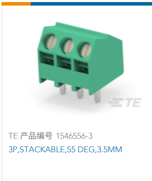
TE 产品编号 1546556-3 3P,STACKABLE,55 DEG,3.5MM