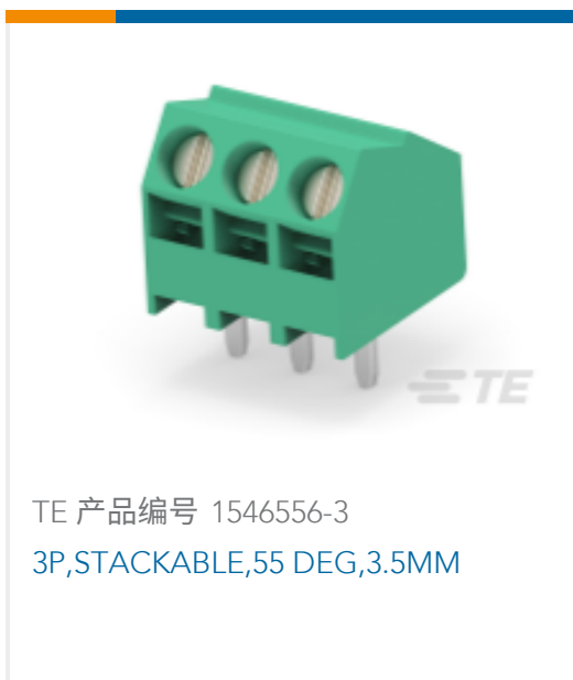
TE 产品编号 1546556-3 3P,STACKABLE,55 DEG,3.5MM