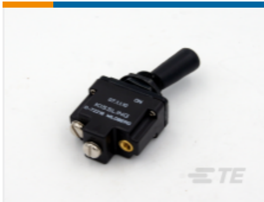
TE 产品编号K1007153 Toggle Switch 08-1-1-13