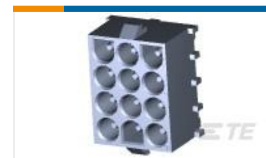
TE 产品编号350433-1 12P UMNL PIN HDR ASSY NATL