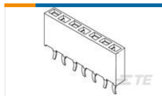
TE 产品编号215297-4 4P HV100 REC CON. TE, 7.0MM