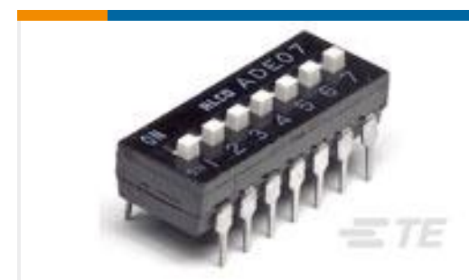
TE 产品编号1825057-1 ADE0204=DIP SWITCH,EXT,THRU/HL