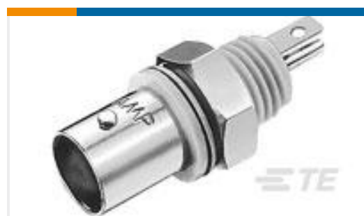
TE 产品编号5227726-1 ISOLATED BNC SOLDER JACK ASSY