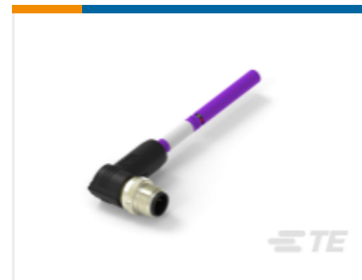
TE 产品编号 TAB62246501-040 M12B2-MR-PUR TORSION-4.0M