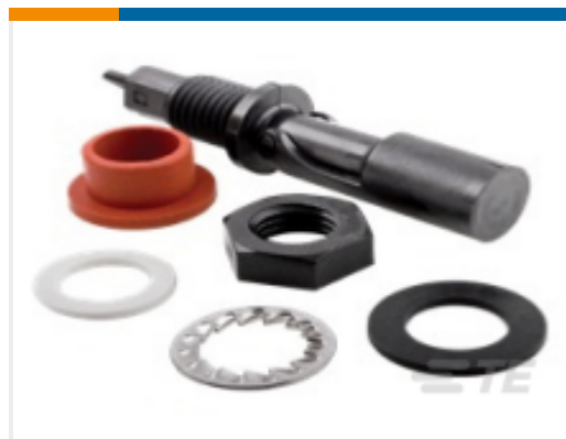
TE 产品编号 80645-000 LS809-51 Liquid Level Sensor