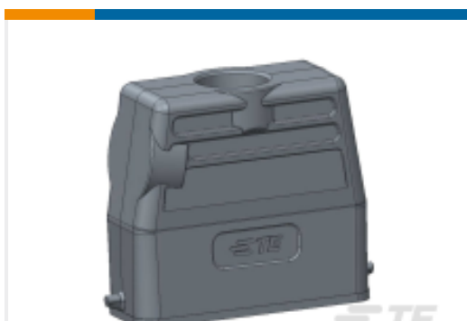
TE 产品编号 T1349160120-000 H16A-TGH-M20