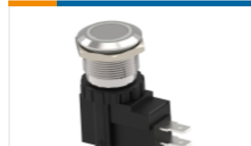
TE 产品编号 2-2364570-8 AVH19 FLT SS LK RNG R&B 24V16A