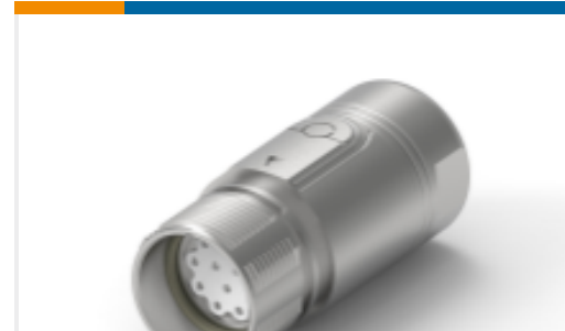
TE 产品编号 AKA012N00410100000 623 EXTENSION, SPEEDTEC