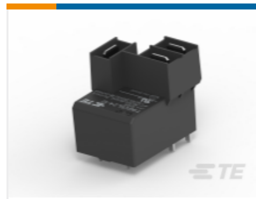
TE 产品编号 1558676-6 T9GS1L24-22