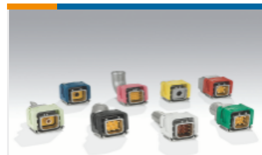
TE 产品编号ZPF000000000100794 DMC-MD 20 C