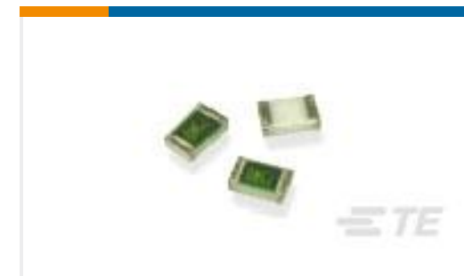
TE 产品编号1676353-2 RN 0805 49K9 0.1% 10PPM 1KRL