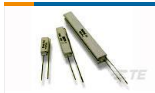
TE 产品编号1-1623729-5 BCHE 17 W 2R2 10%