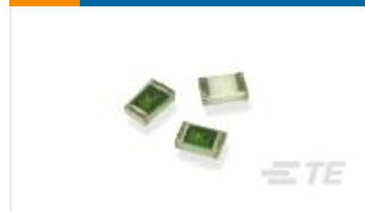
TE 产品编号1676435-2 RN 0805 7K15 0.1% 10PPM 1KRL