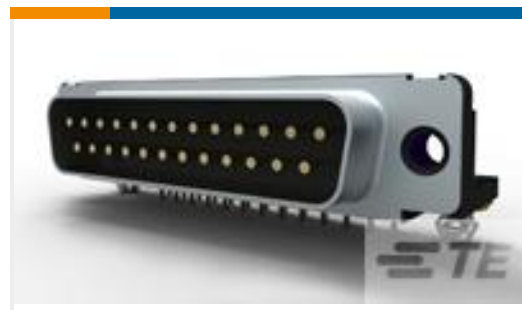
TE 产品编号5747842-4 25 MSFL PLUG RA 318 (IN,FM,BL)