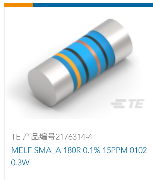
TE 产品编号2176314-4 MELF SMA_A 180R 0.1% 15PPM 0102 0.3W