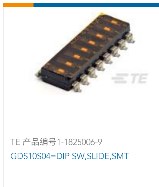
TE 产品编号1-1825006-9 GDS10S04=DIP SW,SLIDE,SMT