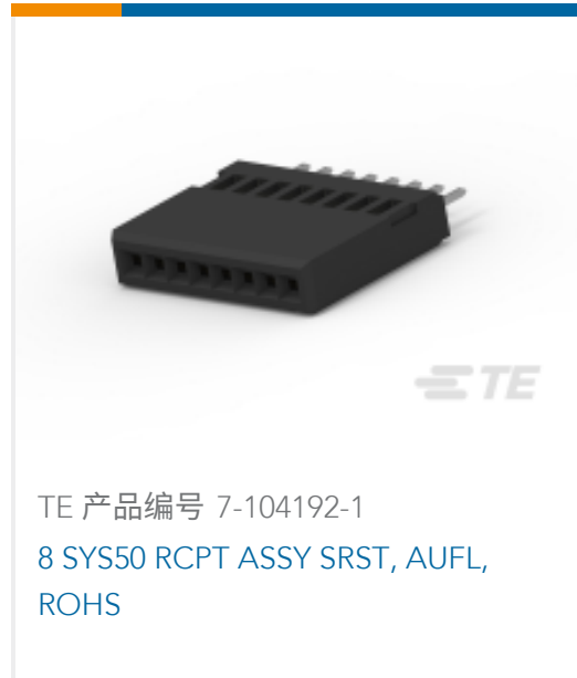
TE 产品编号 7-104192-1 8 SYS50 RCPT ASSY SRST, AUFL, ROHS