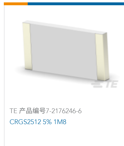
TE 产品编号7-2176246-6 CRGS2512 5% 1M8