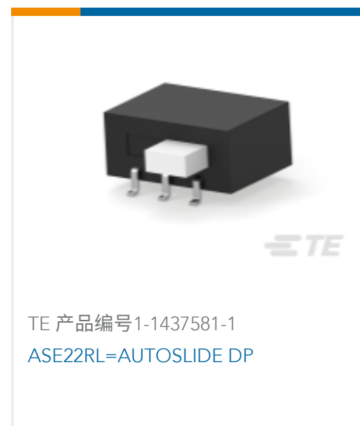
TE 产品编号1-1437581-1 ASE22RL=AUTOSLIDE DP