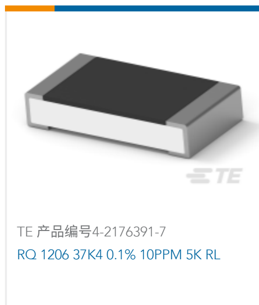
TE 产品编号4-2176391-7 RQ 1206 37K4 0.1% 10PPM 5K RL