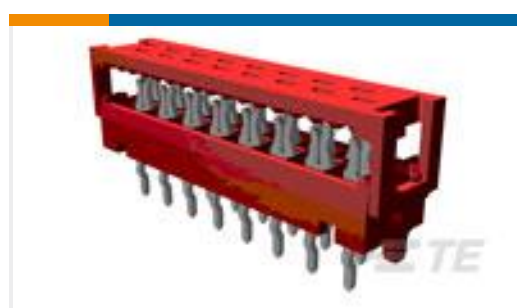
TE 产品编号7-215570-6 MICRO-MATCH PBC 06P