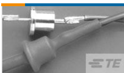
TE 产品编号5677612011 RNF-3000-39/13-0-STK